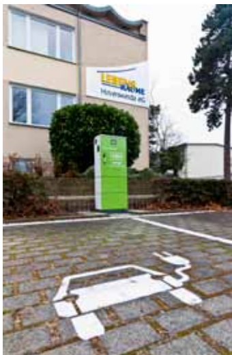
Strom statt Sprit: Die neue E-Ladesäule vor dem Lebensräume-Geschäftssitz

Wer elektrisch mobil ist, hat zwei Möglichkeiten, sein Akku hier „aufzutanken“: entweder per vertragsbasiertem Laden oder spontan ohne Registrierung. Für weitere Informationen und bei Fragen zu den aktuellen Tarifen wenden Sie sich bitte direkt an die Versorgungsbetriebe Hoyerswerda.