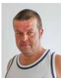
Maik Nieschalke Siedlung 21 Burgneudorf