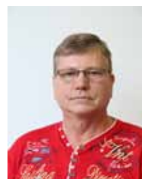
Christian Hinz Str. d. Friedens 3 Hoyerswerda