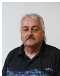
Hans Vogel Am See 27 Lohsa