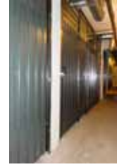
Senftenberger Str. 1