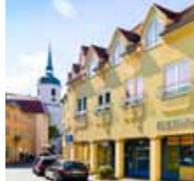
F.-v.-Schill-Str. 5 – 7